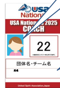
引率パス(イメージ)

4×3cmの顔写真を 引率するチーム分 ご持参ください。 各チームの引率パスに 当日、貼付していただき ます